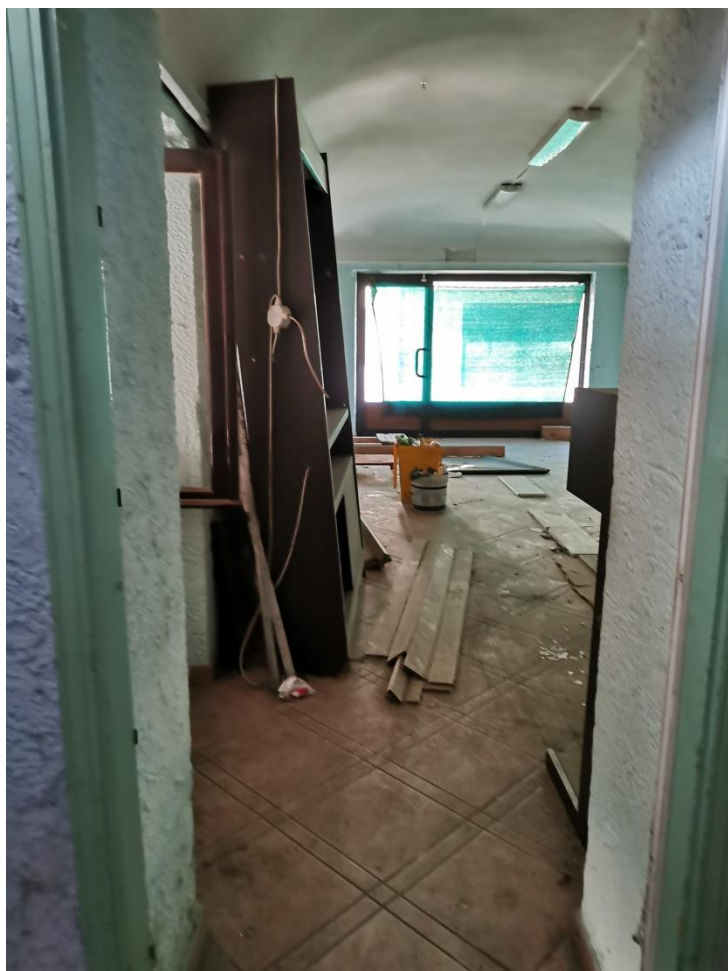
Generale dell'area del prelievo